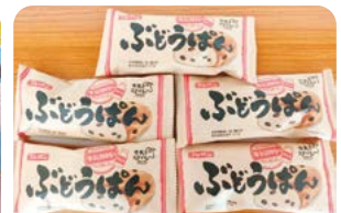
フジパン株式会社下妻工場