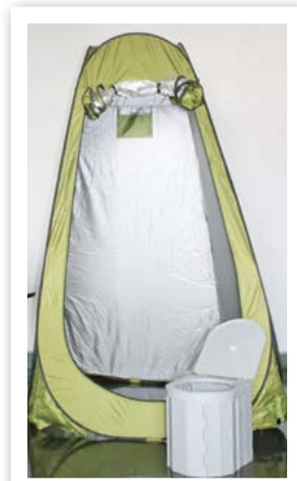
災害用簡易トイレ・テント