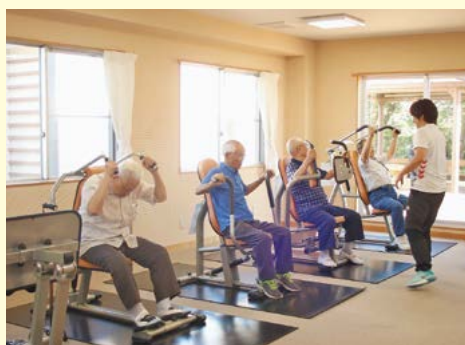
男性のための筋トレ教室