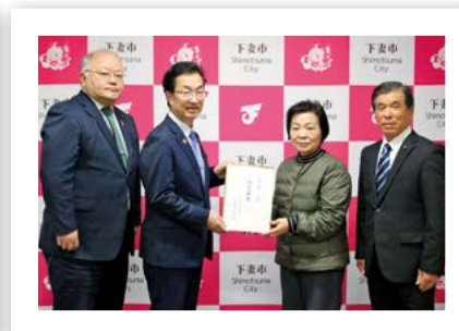
ウイング21・コスモスの会 様