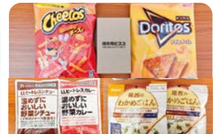
NPO 法人フードバンク茨城