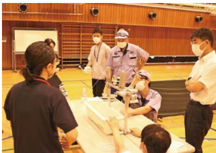
補助具作成の打合せ