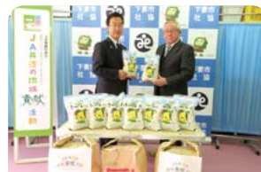
JA 常総ひかり農業協同組合