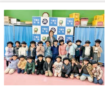
認定こども園 下妻いずみ幼稚園 様