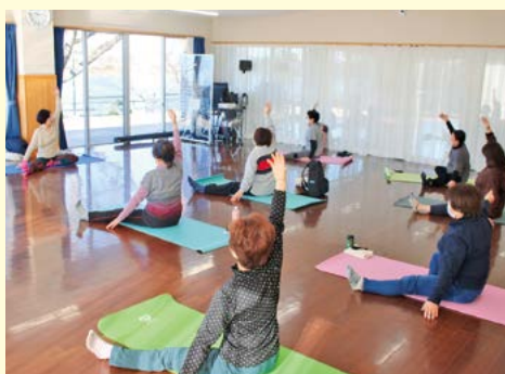
健康&美活ヨガ教室