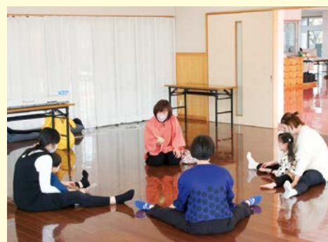
親子リトミック教室