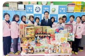
下妻市更生保護女性会