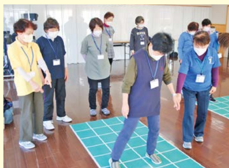
スクエアステップ教室