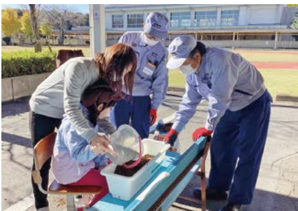
地域交流・花いっぱい活動